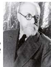
Henri Matisse 1869-1954 était un peintre, dessinateur, graveur et sculpteur français.