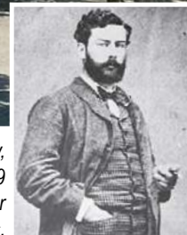
Alfred Sysley, 1839-1899 était un artiste peintre et graveur anglais.